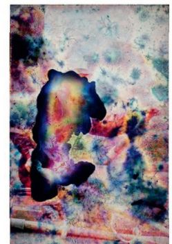
Gallery dix9, Sebastian Riemer - Achrome Boat 2016