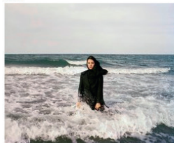
AB43Contemporary, Newsha Tavakolia