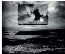
F&C Walter Galeri Jerry Uelsmann -Untitled, 1980