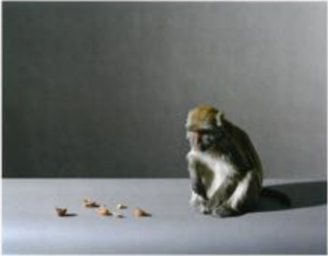
▲ 猴與殼 (2014) 李維基

李維基的這幅作品，以一隻猴子和幾枚殼為主角，展現了猴子的自然行為。這幅作品不僅展示了猴子的自然行為，也反映了藝術家對自然環境的觀察和記錄。