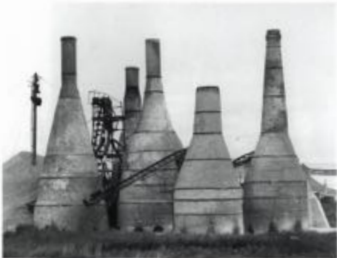
▲ 亞細亞火油公司 (1920年, 1928年, 1931年, 1933年) 的 煙囪 (位於香港中環)

亞細亞火油公司 (Asiatic Petroleum Company) 在 1920年、1928年、1931年、1933年 分別在亞細亞火油公司 (Asiatic Petroleum Company) 的總行 (位於香港中環) 興建了四座 煙囪 (Chimney No. 1, Chimney No. 2, Chimney No. 3, Chimney No. 4) 這些煙囪是亞細亞火油公司 在當時最先進的工業建築之一。這些煙囪 的興建是為了配合亞細亞火油公司在香港 的業務發展。這些煙囪的興建也反映了 當時香港工業的興起。