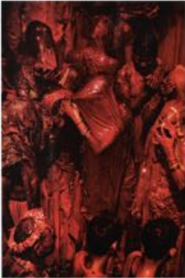
● 在柏林的柏林墙遗址上，人们正在举行纪念活动。

和这些事件中的任何一方，我们只是 想记录下那些正在发生的事情，并 记录下来。我们并不想成为事件的 参与者，我们只是想把事情记录下来。 我们并不想成为事件的参与者，我们 只是想把事情记录下来。我们并不 想成为事件的参与者，我们只是把 事情记录下来。我们并不想成为事 件的参与者，我们只是把事情记录 下来。我们并不想成为事件的参与 者，我们只是把事情记录下来。